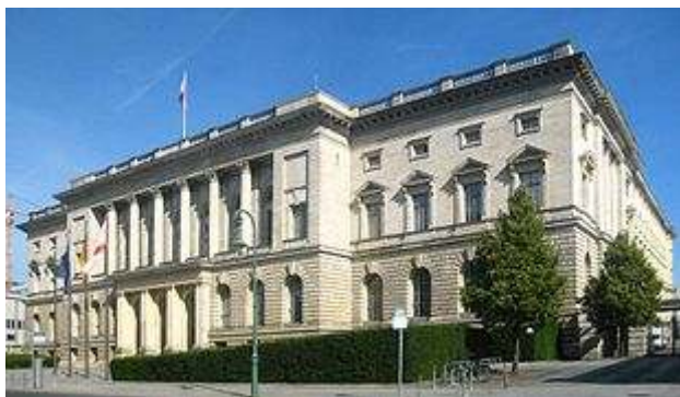
Das Berliner Abgeordnetenhaus im Ortsteil Mitte

Die Wahl zum Abgeordnetenhaus von Berlin ist für Sonntag, den 18. September 2011, beschlossen. Dabei werden in Berlin das Abgeordnetenhaus und die Bezirksverordnetenversammlungen neu gewählt. Wahlberechtigt bei der Abgeordnetenhauswahl sind alle Deutschen, die am Tag der Wahl mindestens 18 Jahre alt sind und seit mindestens drei Monaten in Berlin ihren festen Wohnsitz haben.