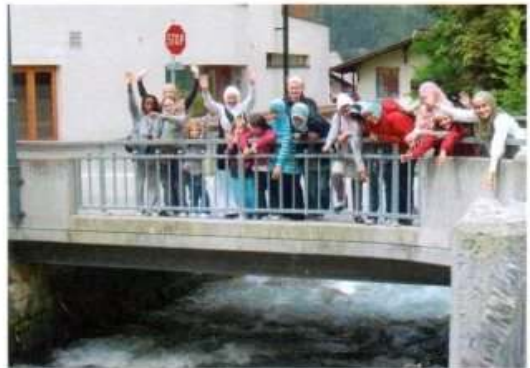
Bilder vom Ferienlager 2010 in Österreich

Inscha Allah fahren wir gemeinsam an einen tollen Ferienort und erleben dort in islamischer Gemeinschaft spannende, erlebnisreiche und gesegnete Tage.